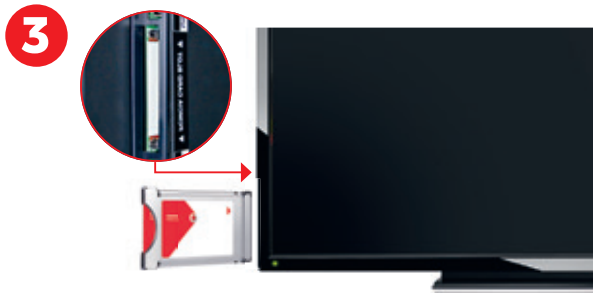
Einschubrichtung kann unterschiedlich sein Abbildung ähnlich

i Setzen Sie das CI+ Modul noch nicht ein.